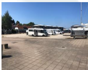
Grusparkeringspladsen, Roskilde Havn

Generalforsamling Roskilde Havneselskab marts 2024