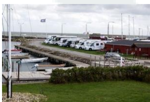
"Eksempel" – autocamperparkering på lystbådehavn

Generalforsamling Roskilde Havneselskab marts 2024